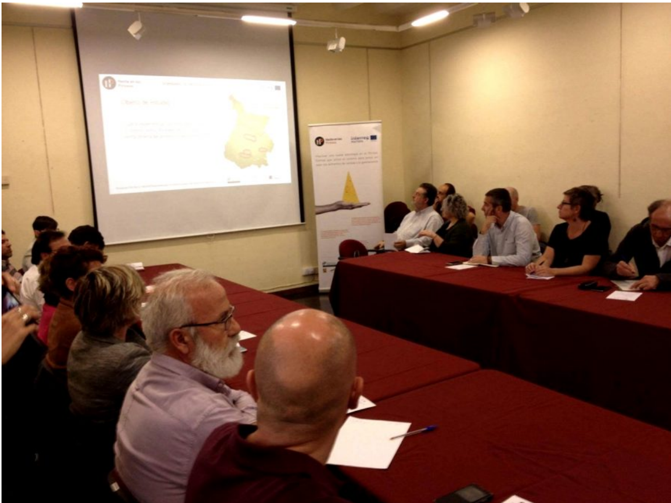
Primer seminario celebrado en Aínsa. III.

El primer seminario de Hecho en los Pirineos, celebrado en Aínsa, ha analizado los resultados de los primeros cinco Mercados en la calle celebrados en Hecho, Aínsa, Boltaña, Villanúa y Benasque